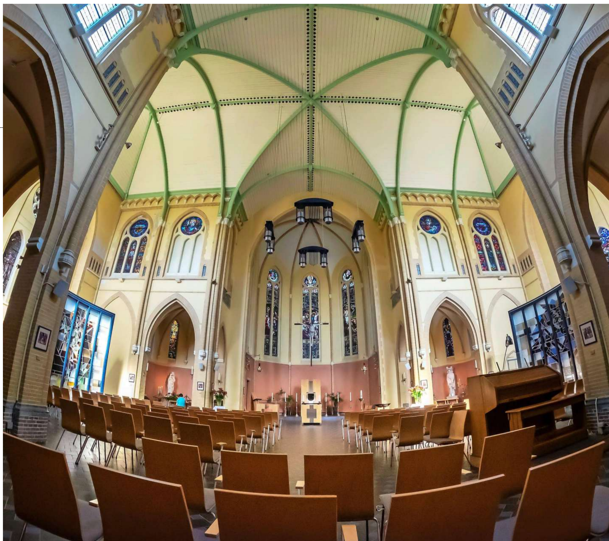
De Sint Josephkerk aan de Nassaulaan begon als bijgebouw.